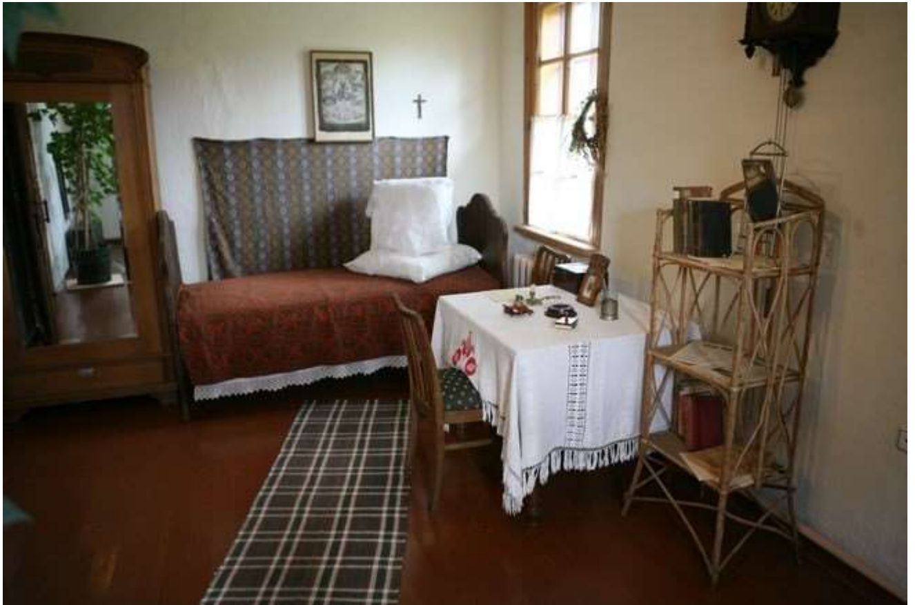
Экспазіцыя філіяла "Яхімоўшчына"