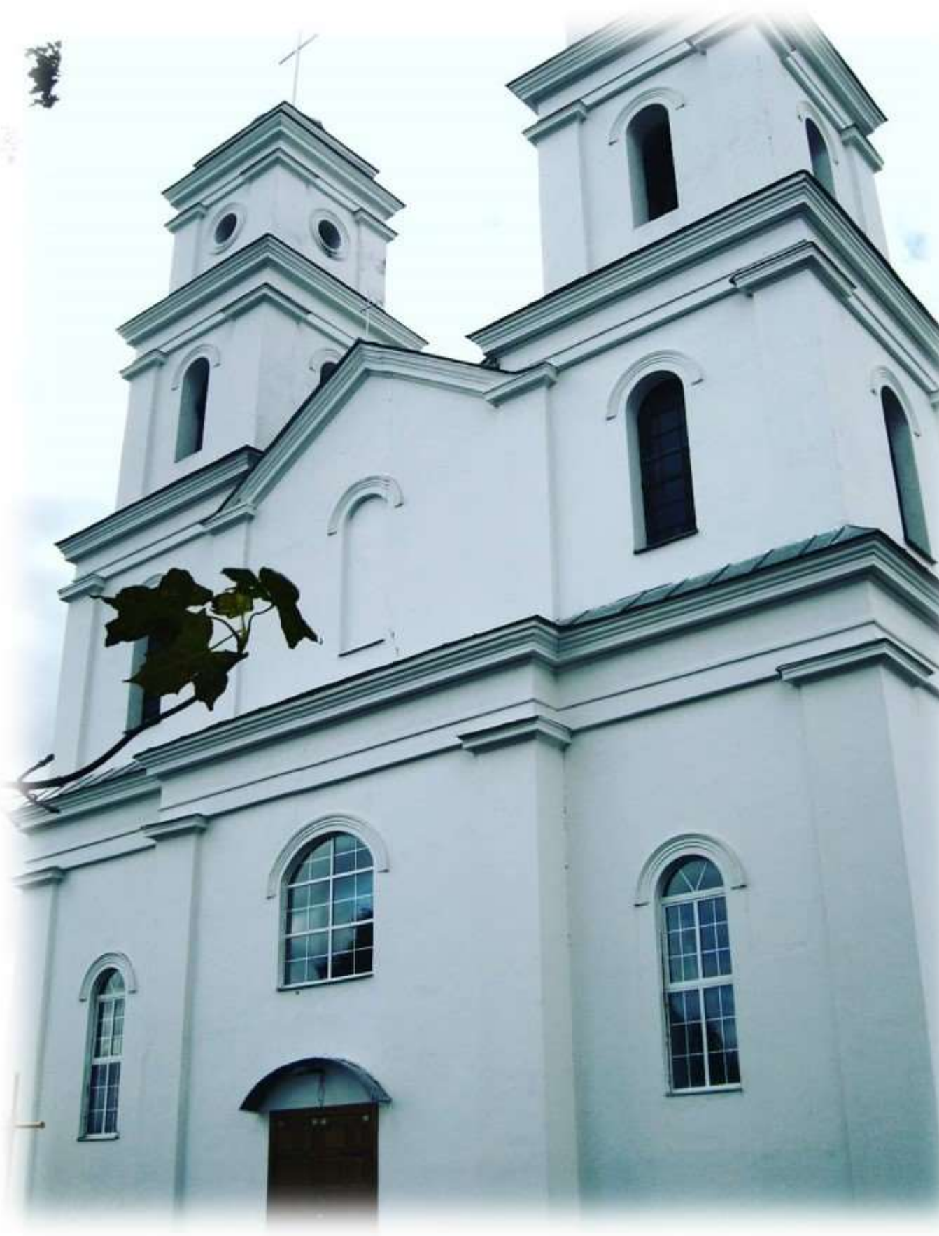
Касцёл Святой Троіцы, у якім хрысцілі Янку