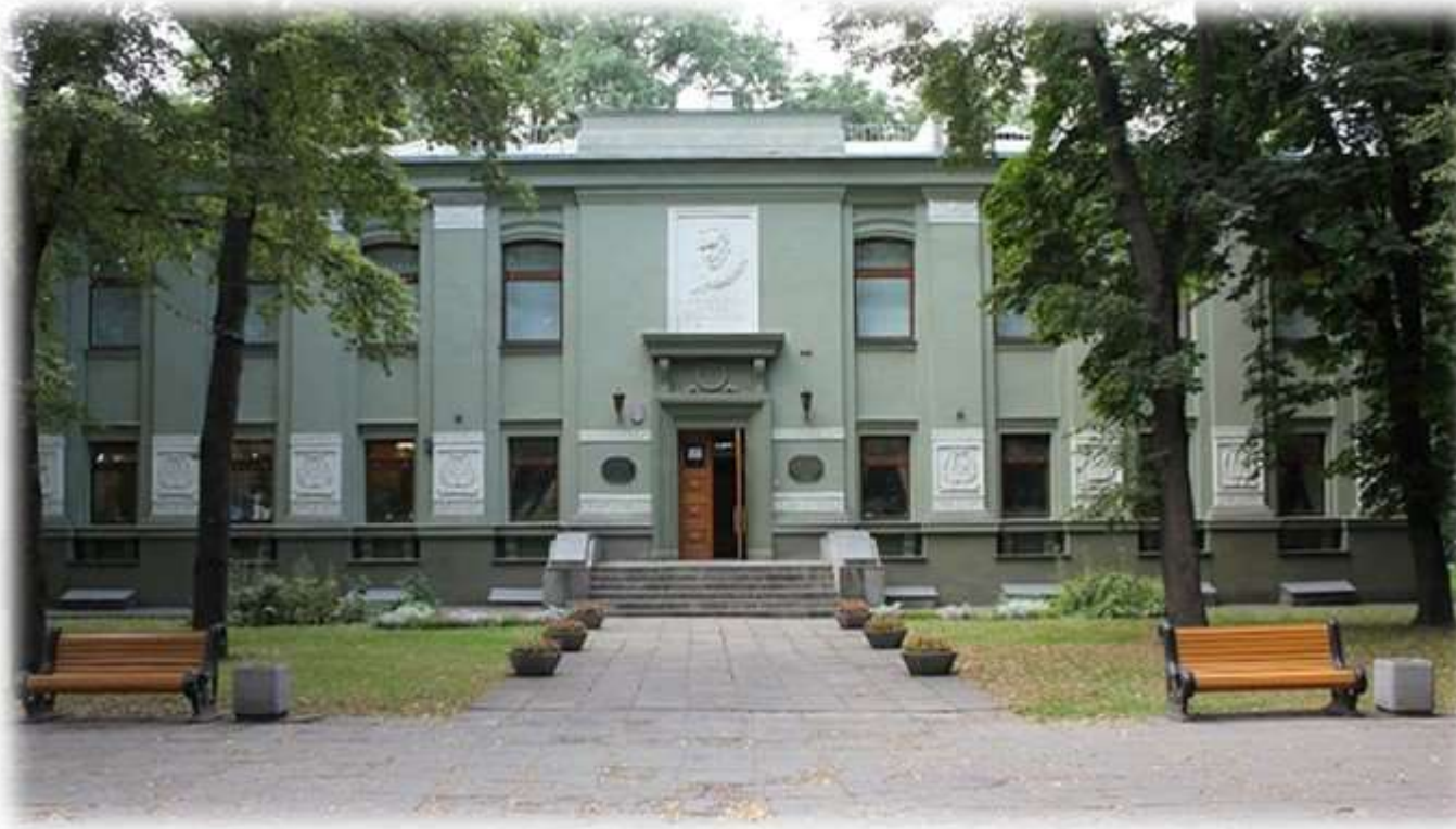
Музей Янкі Купалы ў Мінску