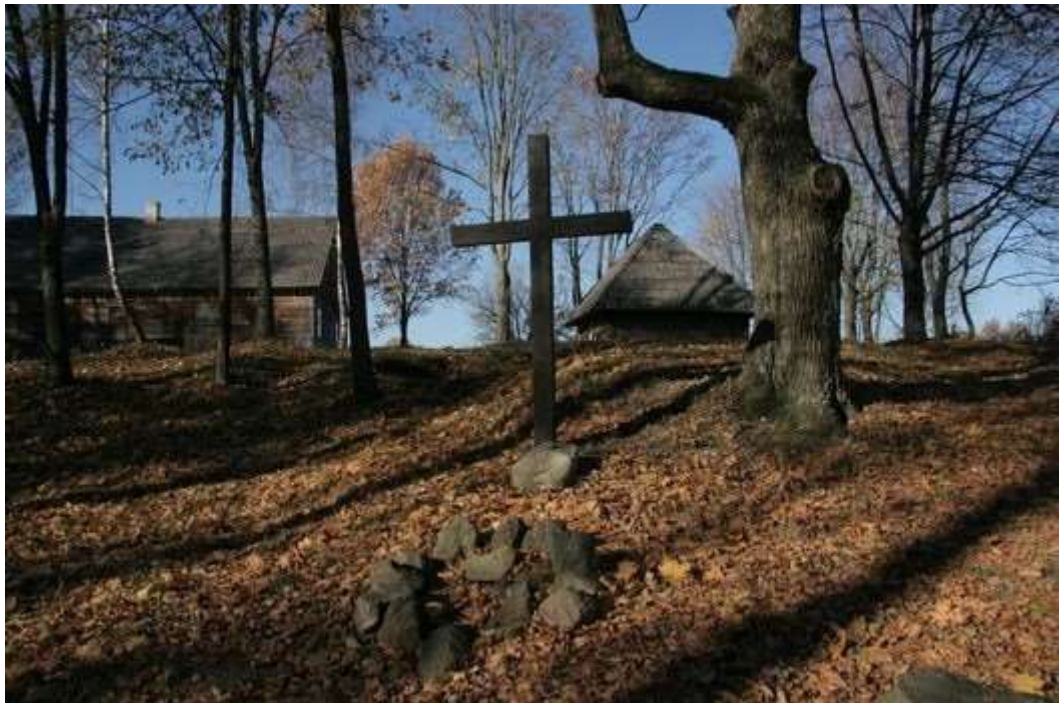
Крынічка, крыж у памяць аб былой сядзібе Міхалішкі