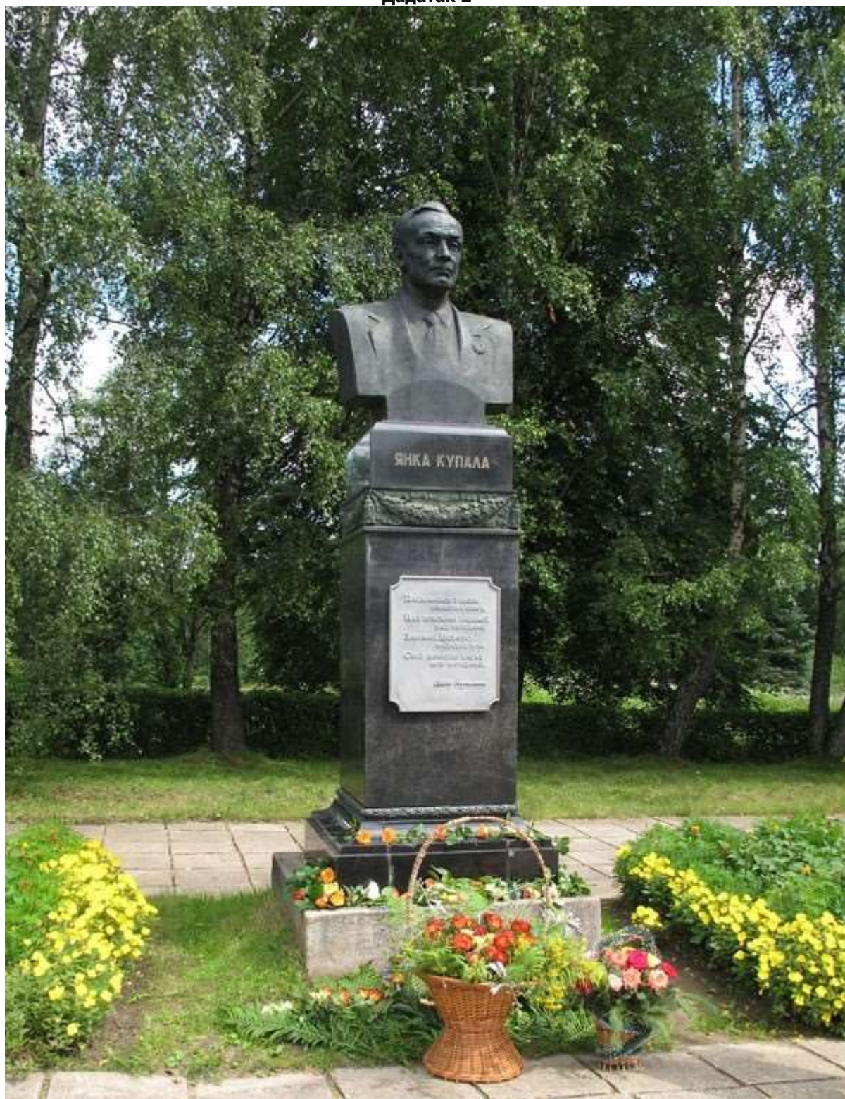
Вязьнка. Помнік паэту