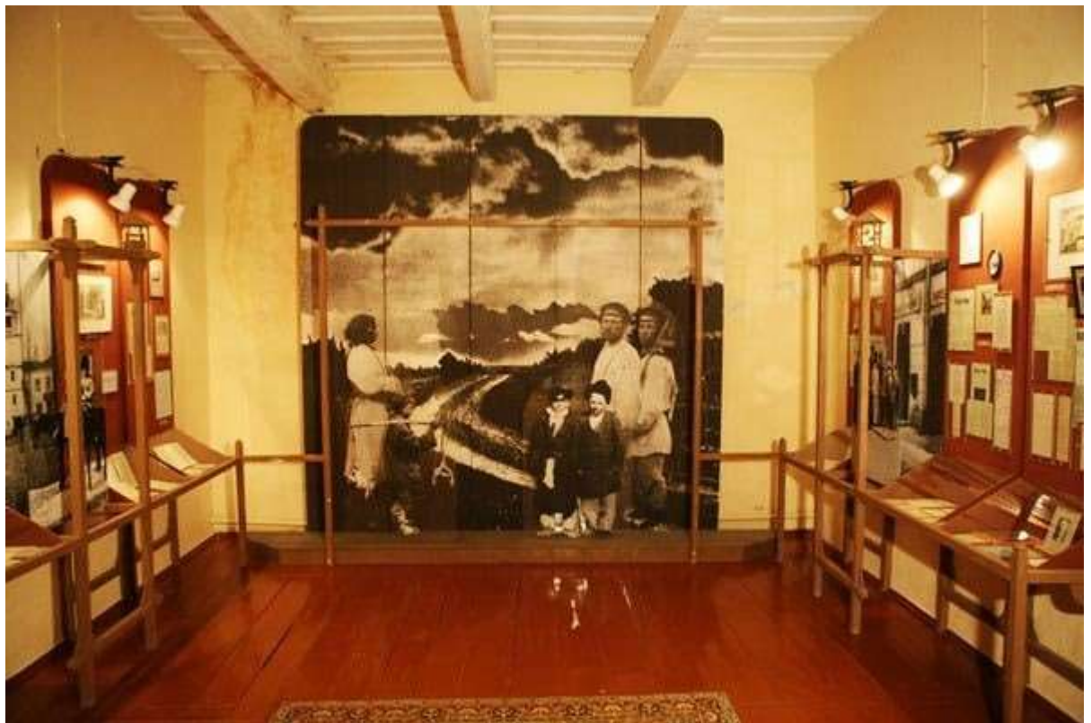
Экспазіцыя філіяла "Яхімоўшчына"