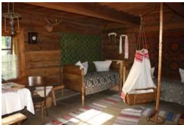
Экспацыя філіяла “Вязынка”