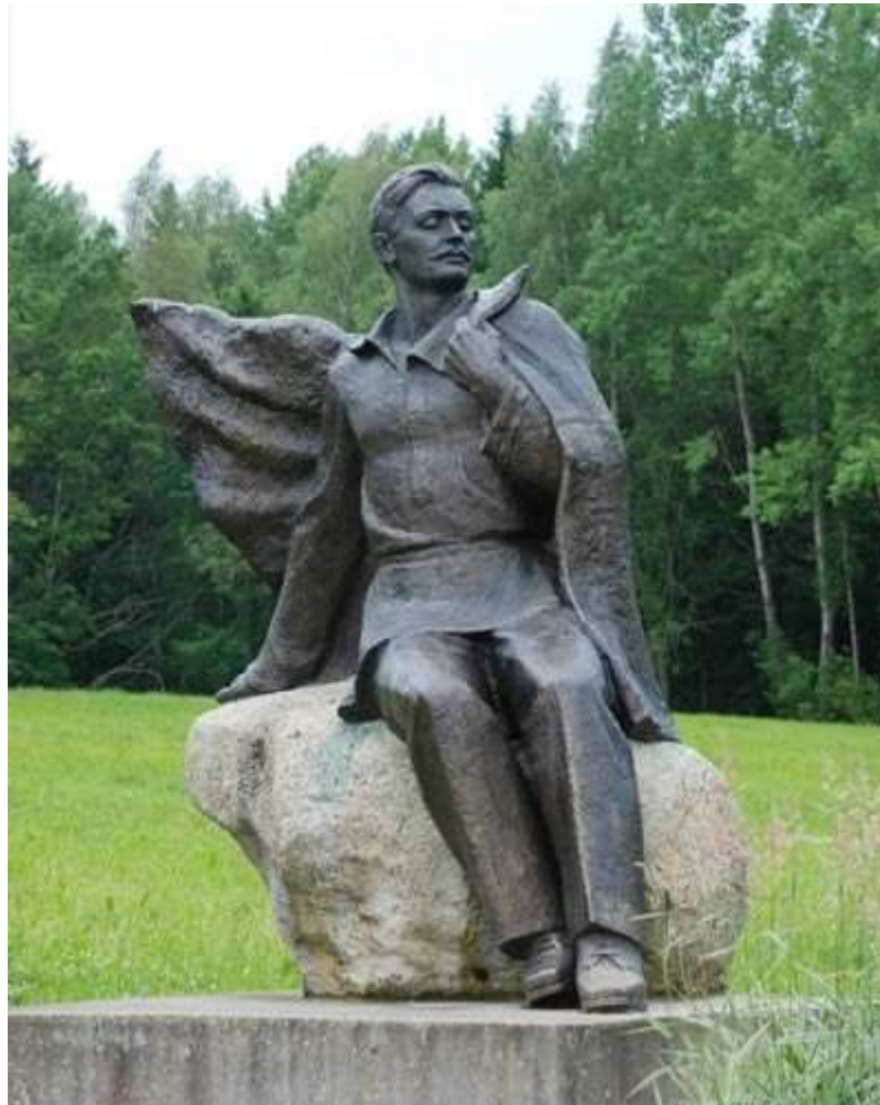
Помнік Янку Купалу