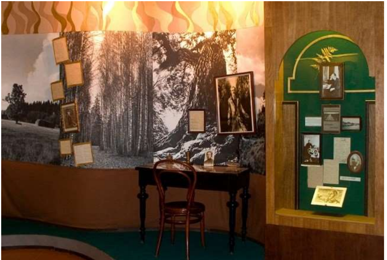
Літературна -документальна експозиція філіяла "Акопы"